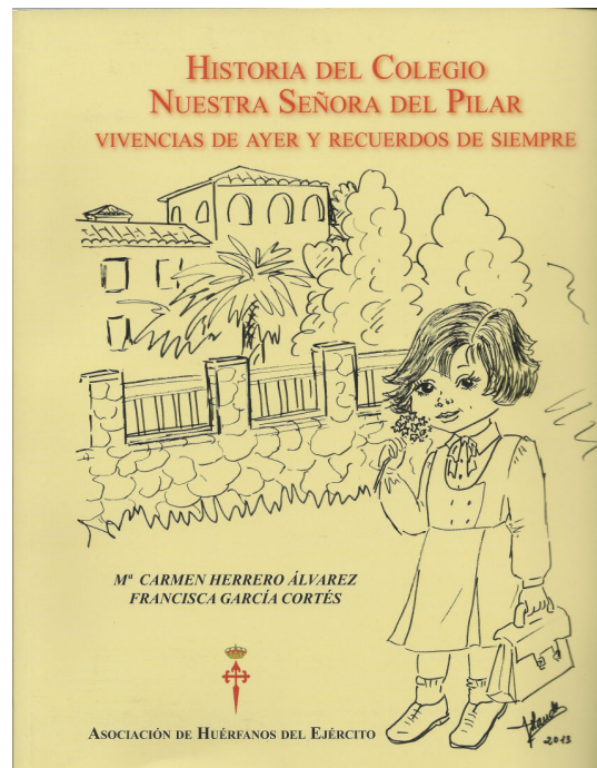
Versión Rústica (R)