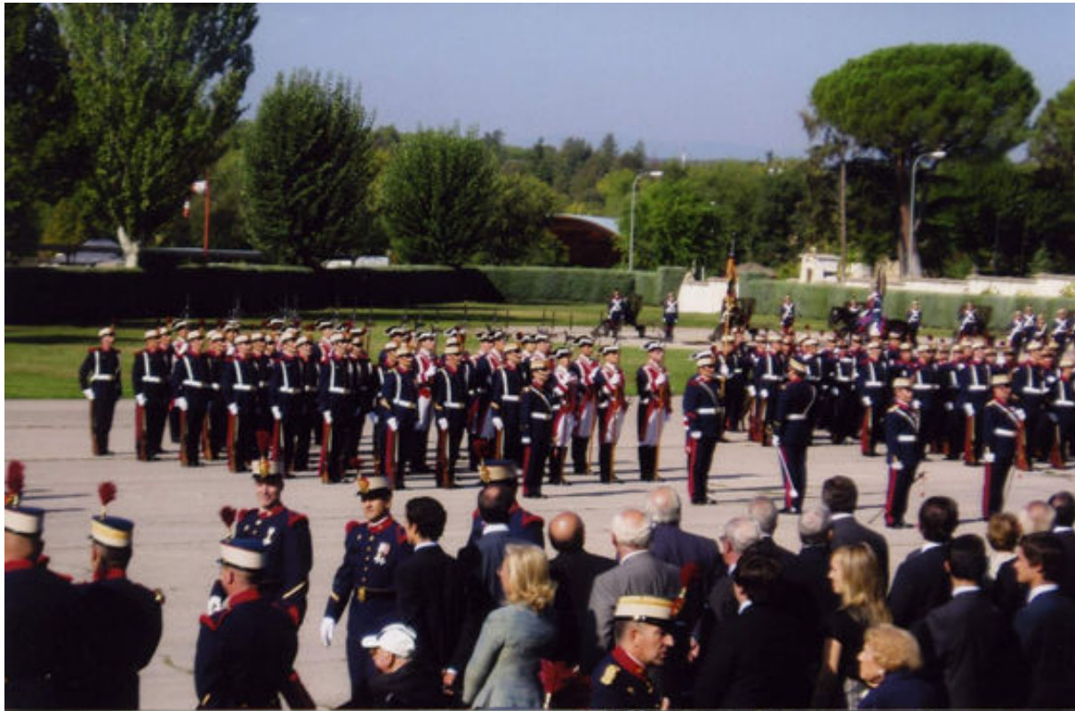
Formación de la Guardia Real