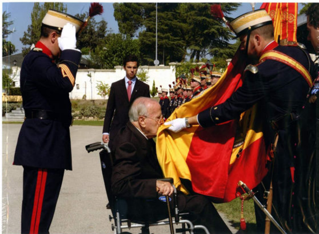
El Decano jurando Bandera

Transcurre su vida de médico como cualquier ciudadano entregado a su profesión y la familia hasta que le llega la hora del retiro, viendo discurrir el tiempo entregado al estudio y a sus recuerdos entre Zamora y Alicante.